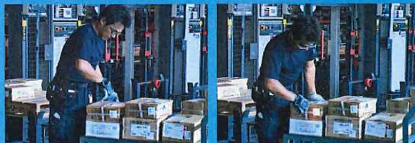
荷札と出荷商品との照合・確認