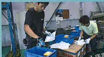
入庫票と 商品チェック

ウェアラブルターミナル (WIT Series) はピッキングで、1品1品を読み取りながら荷物を動かす細かい作業に最適です。