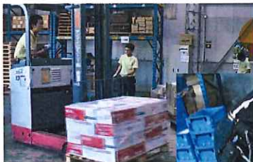
商品の入荷・移動