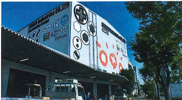
サンコーインダストリー株式会社 東大阪物流センター 第1倉庫