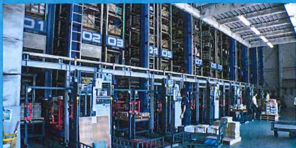
パレットの積荷を自動で振り分ける超高速クレーン