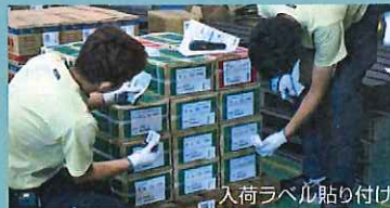
入荷ラベル貼り付け

ハンディターミナル (XIT Series) は入庫や棚卸作業など、一気に複数の荷物バーコードを読ませる作業に役立ちます。