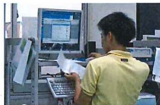
入庫票の発行や出荷指示の管理