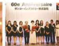
創立60周年記念パーティー