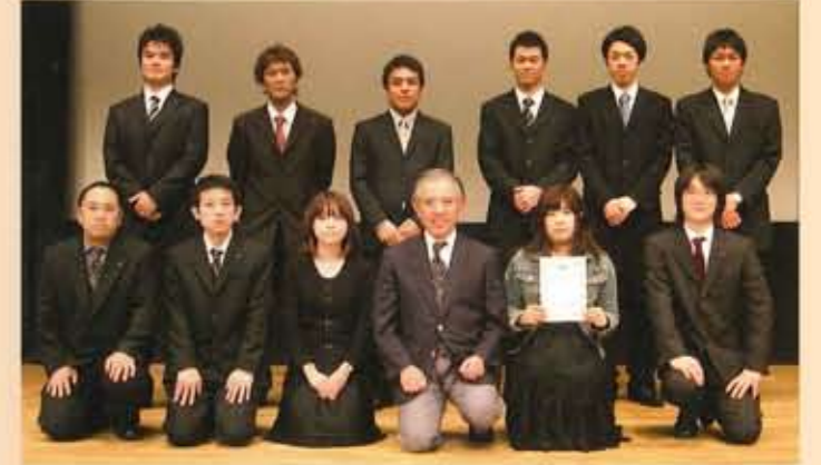
第50回 TQC成果発表記念大会

TQC(総合的品質管理)は、Total Quality Controlの略。仕事の課題や目標をテーマに業務の品質や効率を向上させる活動で、経営体質の充実と強化を図る手法です。サンコーでは1983年(昭和58年)から25年間も取り組み、全社員がいずれかのサークルで活動を実施。現在、夏と冬に成果発表会を行っています。