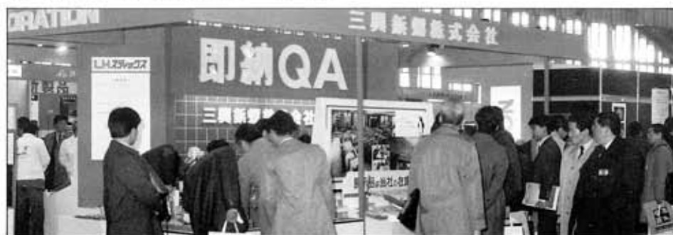
「即納QA」——先端ユーザーの熱い注目、87メカトロニクスジャパン

なわれています。ハードとしての商品管理の自動化とソフト面での商品データの電算処理。私たちが、取り組んできた迅速・正確な在庫管理はこの二本柱によって着実な成果を上げています。